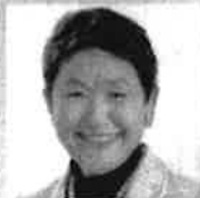
昭和女子大学理事長・総長