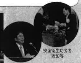
安全衛生功労者表彰等