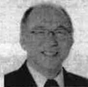
札幌市環境局参与円山動物園担当 旭川市旭山動物園 前園長