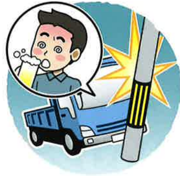
飲酒を伴う交通事故の実態(過去5年間)

飲酒運転は悪質な犯罪であるとの認識をしっかり持ち、二日酔いを含めた飲酒運転の根絶を目指しましょう。 「捕まらなければ大丈夫だ」という間違った考えをしていませんか？ 「飲酒したら運転しない」、「運転する人には飲ませない」を徹底しましょう。