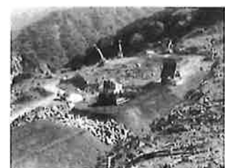
建設機械作業状況