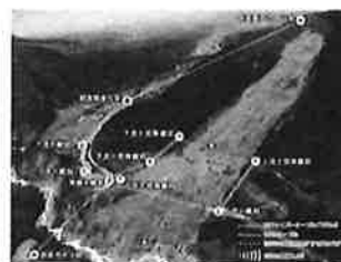
ネットワークシステム